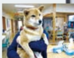
小規模多機能ホーム宇土本町

ご自宅での生活が続けられるように、一人ひとりの希望や生活状況に応じて「通い」「訪問」「宿泊」を組み合わせご利用ができます。家庭的な雰囲気の中で、すべてのサービスを顔なじみの職員から受けられる安心感があります。