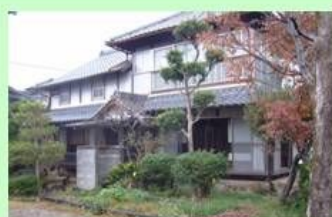
築94年の古民家を利用しています。