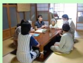
「はなぞの」自慢！？の掘りごたつで談笑。

住所：宇土市花園町佐野1054-1 （立岡公園から約1キロ） （お問合せ先） 電話：0964-24-1225 FAX：0964-24-1226